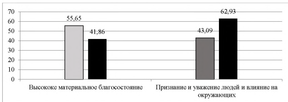
Рисунок 1 – Статистически значимые различия ценностных ориентаций студентов Выборки 1 и Выборки 3 (в ср. рангах)

Однако в сфере психологии и педагогики необходимо пройти путь становления специалиста, и именно с этим мы связываем более низкие показатели по шкале признания и уважения людей, а также влияния на окружающих.