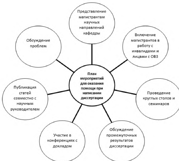
Рисунок 1 – План мероприятий кафедры для оказания помощи магистрантам при написании диссертации

Проблемы и трудности, возникающие в процессе образовательной деятельности с магистрантами, давно обсуждаются в научном сообществе [1, 2, 3, 4], но продолжают оставаться нерешёнными. При этом появляются новые направления и специализации. РГПУ им. А. И. Герцена не стал исключением: на кафедре оздоровительной физической культуры и адаптивного спорта (далее – Кафедра) с 1 сентября 2022 года открыта магистратура по направлению 49.04.02 – «Физическая культура для лиц с отклонениями в состоянии здоровья» (адаптивная физическая культура). За это время профессорско-преподавательским составом накоплен достаточный опыт подготовки магистров по данному направлению. Для оказания помощи обучающимся в освоении магистерской программы кафедрой разработан и осуществляется план мероприятий, представленный на рисунке 1.