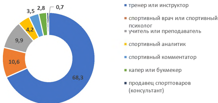
Рисунок 1 – Кем Вы видите себя в будущем?

рование студентов спортивных направлений подготовки с целью анализа их намерений относительно будущей профессиональной деятельности [6]. В данной статье мы представим лишь ответы на вопросы, касающиеся темы исследования: для будущей карьеры (рис. 1) большая часть опрошиваемых выбрала профессию тренера или инструктора (68,3%). Менее популярными оказались такие специальности, как спортивный врач или спортивный психолог (10,6%), а также учитель или преподаватель (9,9%). В качестве капера или букмекера видят себя лишь 2,8% студентов.