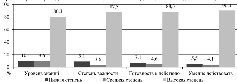
Рисунок 3 – Данные анонимного анкетирования обучающихся 1–3 курсов ИвГУ по вопросам отказа от беспорядочной половой жизни

достают мобильный телефон на занятии для общения в социальных сетях, причем треть обучающихся (34,4%) делают это постоянно и неоднократно, несмотря на замечания преподавателей. Занимаются просмотром различного видеоконтента или играют в Интернет-игры во время проведения занятия в вузе почти каждый десятый студент (9,4%).