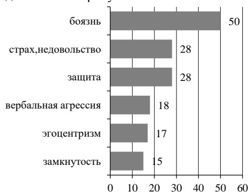
Рисунок 3 – Результаты проведения проективной методики «Несуществующее животное» (в %)

Данные, представленные на рисунке 3 позволяют сделать вывод о том, что замкнутость в проективных рисунках присутствует у 15% подростков; эгоцентризм выявлен у 17% испытуемых; вербальная агрессия характерна для 18% подростков; защита и страх проявляются в рисунках 28% подростков; боязнь, нерешительность выявлена у 50% подростков. Полученные результаты позволяют отметить, что у половины подростков нашей выборки выявлены боязнь, нерешительность. В меньшей степени для них характерны замкнутость и вербальная агрессия, а защита, страх и недовольство в процентном отношении у подростков представлены практически в равной степени. Из всех видов агрессии доминирующей выступает вербальная. Для подростков, которые ее используют в отношениях