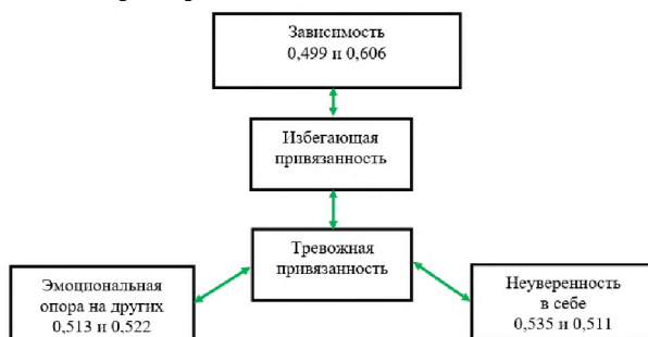
Рисунок 2 – Взаимосвязи типов привязанности с характеристиками межличностной зависимости

Оба типа привязанности имеют отрицательные взаимосвязи с положительными характеристиками самооотношения и положительные взаимосвязи с отрицательными характеристиками самооотношения. Выявлены значимые корреляции между типами привязанности и характеристиками межличностной зависимости (рис. 2).