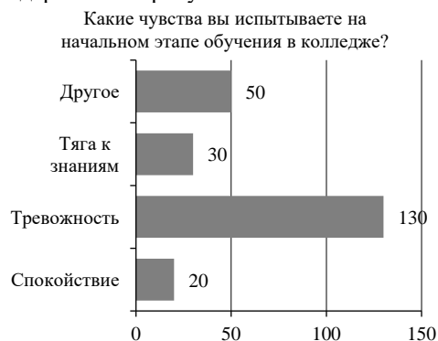
Рисунок 1 – Ответы респондентов на 1 вопрос анкеты Рисунок 2 – Ответы респондентов на 2 вопрос анкеты

Отвечая на вопрос о трудностях (результаты приведены на рисунке 3), испытываемых студентами-респондентами на данный момент, проблему нахождения в группе агрессивно настроенных ребят обозначили 10 студентов (5%). Проблему учебного плана, а именно неинтересные занятия в программе обучения отметили также 10 студентов (5%), а трудности в плане сосредоточенности на учебном процессе и материалах учебы 90 студентов (45%). Оставшаяся же часть – 90 студентов (45%), как показало исследование, не испытывает никаких трудностей в настоящее время, у них всё хорошо.