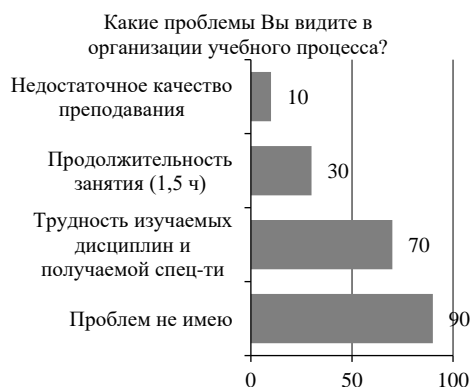
Рисунок 3 – Ответы респондентов на 3 вопрос анкеты Рисунок 4 – Ответы респондентов на 4 вопрос анкеты

Респонденты, в лице студентов ККМБК первого курса, дали следующие ответы на пятый вопрос анкеты «Удовлетворены ли Вы отношением со стороны преподавателей и сотрудников?». Результаты ответов продемонстрированы на рисунке 5. Полностью удовлетворены оказались 170 студентов (85%), тогда как не удовлетворены – 20 студентов (10%). Своё, индивидуальное, мнение по этому вопросу высказали 10 студентов (5%).