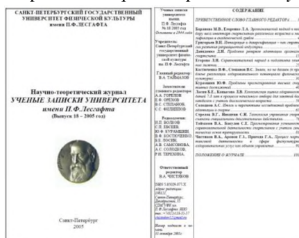
Рисунок 2 – Обложка и содержание 18 выпуска