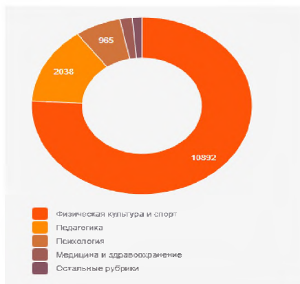
Рисунок 3 – Распределение по тематике публикаций ( https://www.elibrary.ru/title_infographics.asp?id=25203 )