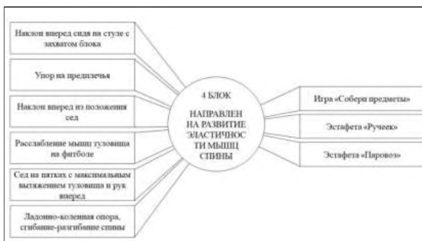
Рисунок 4 – Четвертый блок