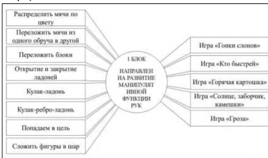
Рисунок 1 – Первый блок

Содержание разработанного комплекса физических упражнений представлено на рисунках 1-4.