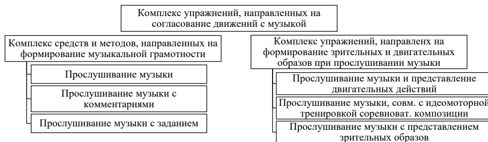
Рисунок 2 – Направленность комплексов заданий на совершенствование артистического компонента мастерства спортсменок в художественной гимнастике

На основе полученных данных было конкретизировано содержание комплексов средств и методов, обеспечивающих формирование и совершенствование технико-эстетического компонента исполнительского мастерства гимнасток (рисунок 2).