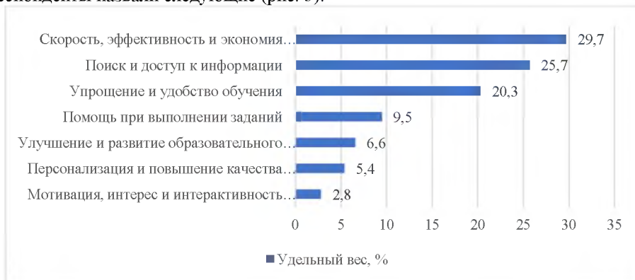
Рисунок 3 – Основные преимущества использования ИИ, по мнению студентов

В качестве основных преимуществ использования ИИ в учебном процессе респонденты назвали следующие (рис. 3).