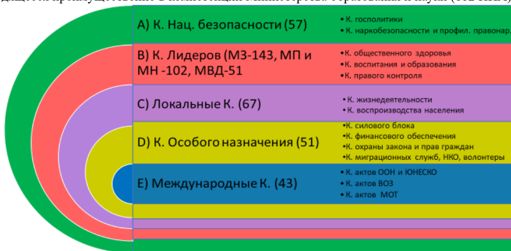
Рисунок 2 – Кластерная схема нормативно-правового поля заботы о здоровье межведомственного и межсекторального взаимодействия. В утверждении 514 НПА участвовало 42 органа законодательной власти, министерства и ведомства

Распределение количества НПА в кластерах национальной безопасности по сохранению здоровья, при анализе общих вопросы политики здоровья и благополучия зафиксировано 33 правовых акта, а среди политики в интересах детей, молодежи и семьи отмечены 29 документов. В кластере Лидеров анализ НПА выглядит следующим образом. Кластер воспитания и образования детей и молодежи, в котором собрано законодательство, находящееся преимущественно в компетенции Министерства образования и науки (102 НПА).