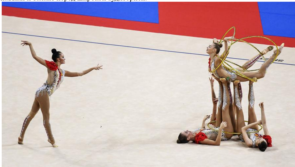
Рисунок 2 – командное упражнение по художественной гимнастике.

Командные соревнования позволяли выявить лучшие команды и отдельных гимнасток, соперничающих в различных дисциплинах и программе упражнений. Участие во Всесоюзном конкурсе было престижным и давало возможность гимнасткам показать свои навыки и талант перед широкой аудиторией.