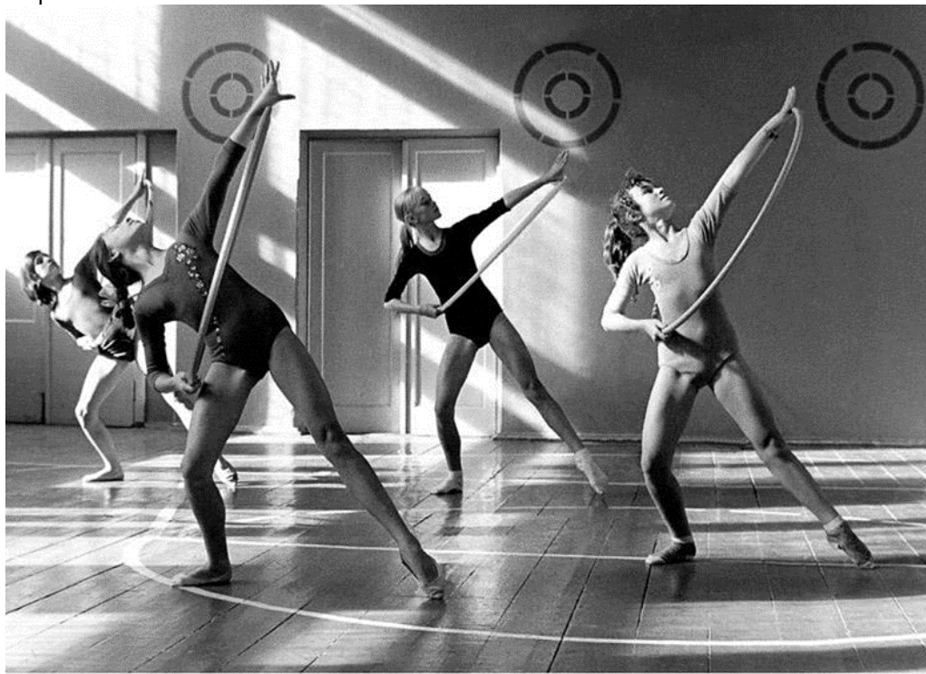
Рисунок 1 – занятие по художественной гимнастике в университете Лесгафта. Автор Анатолий Лисовский

Это мероприятие стало важным шагом в развитии художественной гимнастики в СССР. Соревнования привлекли внимание и интерес со стороны спортивных организаций и общественности. Они позволили показать потенциал и талант молодых гимнасток, а также продемонстрировали развитие методики обучения и тренировки в этом новом виде спорта.